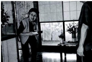
配食サービスの様子

実施要項の第一条(目的)では、在宅の一人暮らし高齢者等に配食サービスにより健康増進と生活支援を図ると共に、安全の確認を実施し、安心・安全な生活を確保することを謳っている。 第3条(対象者)の内容は高齢者世帯、独居高齢者並びに身体障がい者で、老衰心身の障がい者等調理が困難な者である。