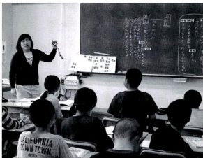
湯沢学園の授業風景

答弁 教育委員会の判断を基本として非公表とするが、非公表継続の是非を検討するよう総合教育会議の場で発言していきたい。