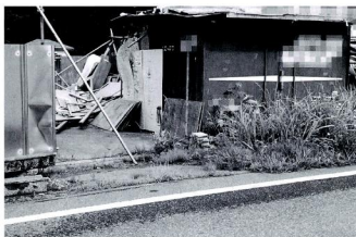
景観上も好ましくない