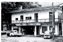
シルバー人材センターが入るやすらぎ荘