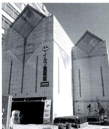
壁画のまちづくり 長野県岡谷市 イルフ壁画館