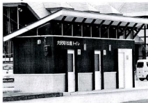
穴沢河川公園トイレの冬期開放を

が頻繁に動き危険なため、トイレ解放は考えていないが、雪消えを待つて開放したい。トイレの表示についても利用者にはわかるように検討する。