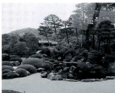
壁画展示のある、島根県安木市 定立美術館

質問 将来を見据え最良の選択となるよう、調査費を付けても、町民と議会が納得できる判断材料が必要だ。いかがか。