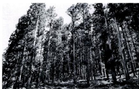
伐採される町有林

A 災害復旧費を予測することはできないため計画に入れることはできない。今後も災害が発生した場合、必要な復旧費を予算計上する。平成27年度に支柱の補強を行った。山頂駅は急傾斜地にあり地盤も弱い場所である、今回の工事により安全性を確保したい。