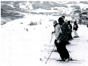
中学生のスキー練習風景