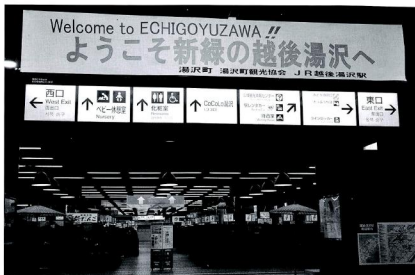
西口を「温泉街口（西口）」、東口を「雪国中央口（東口）」の方がわかりやすいのでは