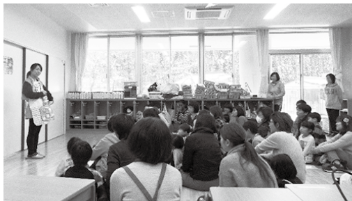
保育園年長児親子食育事業