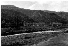
魚野川「六沢河川公園」

26年度に創設した「リゾートマンション交流促進補助金」の利用がこれまでに67件ありました。このうち21件は地域との交流を目的としたものであり、これらを通じてコミュニティの輪が更に拡がることを期待しています。また、本年度からマンション管理組合理事長等連絡会議の在り方を二部制とし、一部は例年どおり町や警察などからの報告等の場とし、二部はマンション関係者がそれぞれの問題点などを発表し合うなど、マンション関係者の情報共有の場といたします。