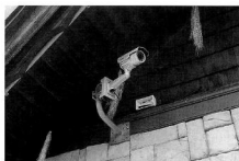
防犯カメラの設置

近年、各地で発生している大規模な自然災害などにより、住民の「防災」への意識は非常に高まっています。これを受け町では、平成29年度までに緊急