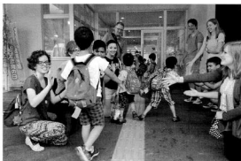
姉妹都市マグナとの交流事業

本年度は3年ごとの固定資産税の評 価替の年であり、固定資産税は減少し たします。住民税関係では、平成29年 11月からマイナンバー制度に基づく情 報連携が本格稼働いたしましたので、 事務の効率化を図るなど、適正な課税 に利用してまいります。徴収関係では 市町村と県の合同徴収組織である「新 潟県地方税徴収機構」が、高い徴収率