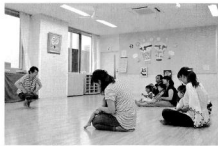
総合子育て支援センター ジャンプラネット

床転換が円滑に行われるよう指定管理者に協力するとともに、湯沢病院が「かかりつけ医」として、また観光の診療体制を継続するために、指定管理者と緊密に連携し、効率的・計画的な医療機器の更新など機能維持に努めてまいります。