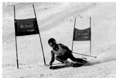
来年、苗場スキー場にて開催される全国中学校スキー大会アルペン競技大会の支援

事業支援では、「フジロックフェスティバル20周年記念事業」並びに、平成31年2月に苗場スキー場で開催される「第56回全国中学校スキー大会アルペン競技大会」、そして、8月3日に新潟総合テレビ（NST）と雪国青年会議所が共催する「大相撲雪国湯沢場所」を支援してまいります。また、新潟県が苗場スキー場への誘致を目指す「2020年男子ワールドカップアルペンスキー大会」は、この開催が決定し次第、町としてできることを検討し、支援してまいります。