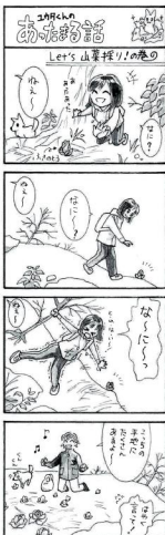
山草はおいしくクワが産卵の場をつと。