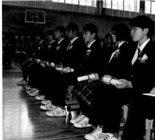
(写真：中学校卒業式)

3月吉日、湯沢学園において認定こども園卒園式、小・中学校卒業式が執り行われました。式当日は雪模様の日もありましたが、寒さにも負けず、子どもたちは堂々とした姿で式に臨んでいました。