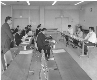
〈群馬県大泉町視察時のひとコマ〉