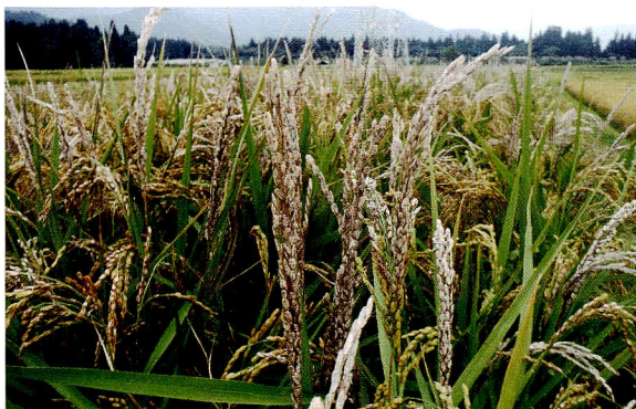
台風により白穂になった稲（南魚沼市）

8月に発生した台風15号による強風などの影響で、白穂と変色糊の被害が南魚沼地域と中魚沼地域を中心に各地で発生しました。さ