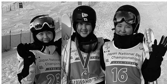
左から中澤選手、川村選手、小野塚選手