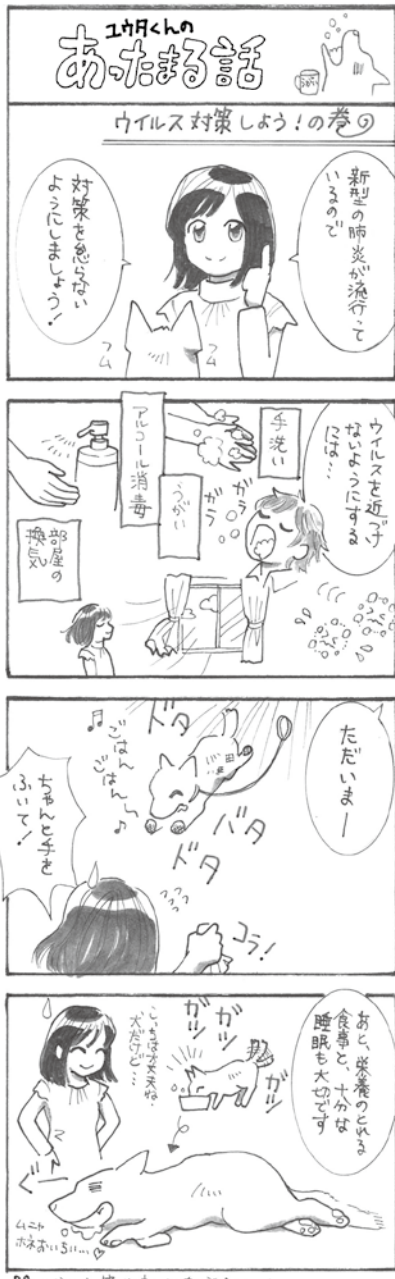
十分は対策と健康に気を配ることも