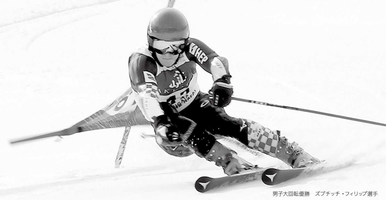
男子大回転優勝 ズブチッチ・フィリップ選手