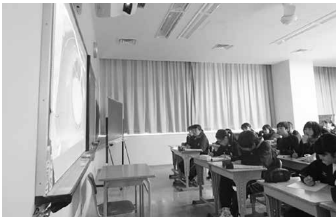
『北越雪譜』について学習しています

2月から、1年間の学びを生かして立志式のための原稿作成に取りかかりました。どのような『志』を話すのを楽しみにお待ちください。 なお、立志式は、新年度5月21日(金)に延期となりました。