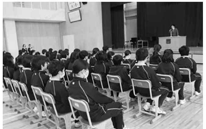
リハーサルをしています