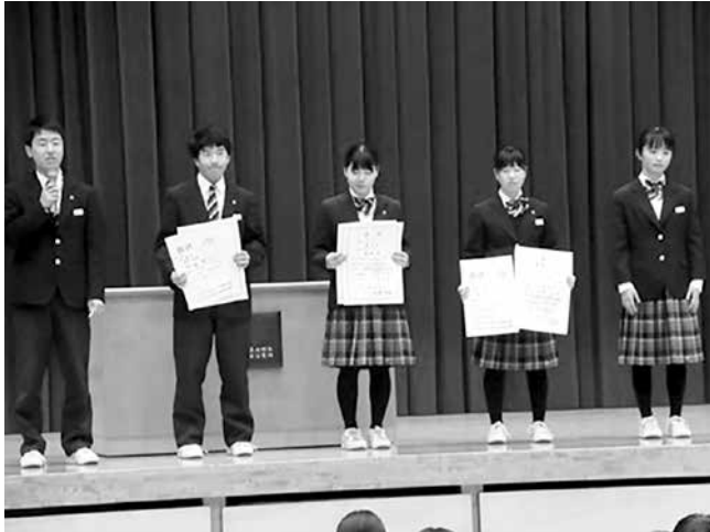
大会報告するアルペンスキー部

第32回中越スキー選手権大会兼第57回中越地区中学校スキー大会が1月7日(火)～10日(金)に、かぐらスキー場で行われました。湯沢中学校からはアルペンスキー部5名が参加しました。感謝の気持ちを力に変えて活躍してきました。