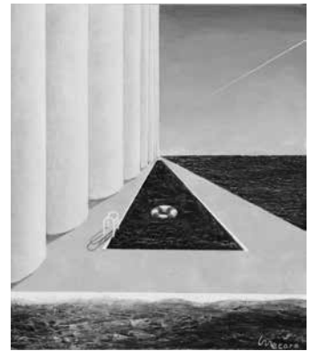
佳作 「テセウスの船」 穂波梅太郎 (大阪府)