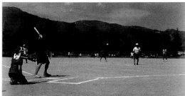
写真: 町民ソフトボール大会