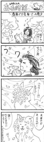
ゆざわの春(2019年) 4月号のあたま話