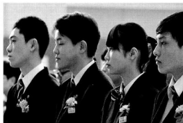
凛々しい表情で式に臨む卒業生（中）

式終了後は各クラスで保護者の皆さまも交えて最後のホームルームが行われました。9年生は生徒一人一人がクラスメイトの前で感謝の言葉や今の気持ちを発表、6年生は保護者の皆さまから子ども達へ手紙がサプライズで手渡されました。子ども達は照れた表情を見せていましたが、名残惜しそうに最後のひと時を過ごしていました。