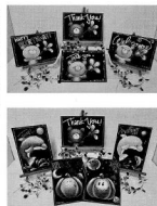
(写真は制作予定の作品)