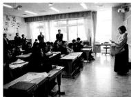
今まで一緒に過ごしてきたクラスメイトと最後のホームルーム（写真左から小、中）