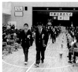
在校生に見送られながら退場（小）