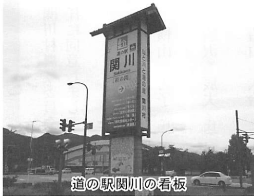
道の駅関川の看板