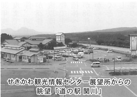
せきかわ観光情報センター展望所からの 眺望「道の駅 関川」

いずれにしても、管理公 社が現状のままが良いとは 思っていません。「管理」か ら「活用」への方向へと組 織改革を進めていきたいと 考えています。