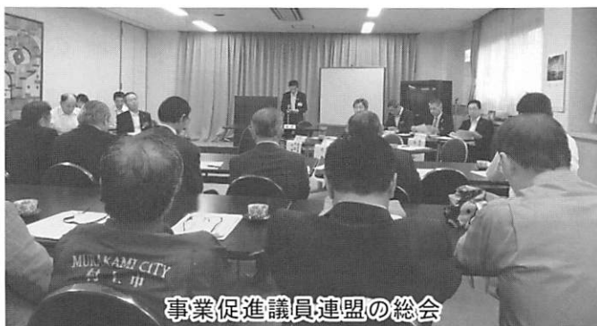
事業促進議員連盟の総会

6月27日(水)に森林基幹道岩船東部線開設事業促進議員連盟の村上市議会議員と関川村議会議員が合同で工事の進捗状況を現地視察しました。 この森林基幹道は村上市北部にある笹平地区から関川村の宮前地区までの里山の丘陵を通る延長が約21.9km、幅員4mのアスファルト舗装の林道です。 平成29年7月10日に起工式が行われ平成38年度完成を目指し現在、順調に工事が進められています。