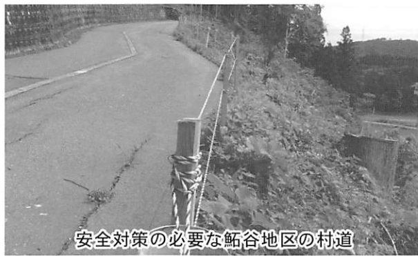
安全対策が必要な鮎谷地区の村道