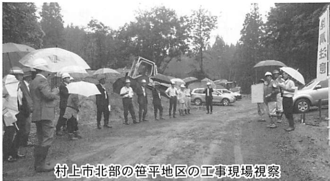
村上市北部の笹平地区の工事現場視察

6月27日(水)に森林基幹道岩船東部線開設事業促進議員連盟の村上市議会議員と関川村議会議員が合同で工事の進捗状況を現地視察しました。 この森林基幹道は村上市北部にある笹平地区から関川村の宮前地区までの里山の丘陵を通る延長が約21.9km、幅員4mのアスファルト舗装の林道です。 平成29年7月10日に起工式が行われ平成38年度完成を目指し現在、順調に工事が進められています。