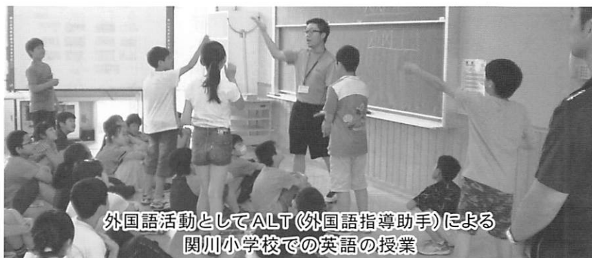
外国語活動としてALT(外国語指導助手)による 閔川小学校での英語の授業

これからは、外国人観光客を招き入れるため、またいろいろな意味においても英語・外国語の授業は必要不可欠である。村の良観光客に対して、村の良