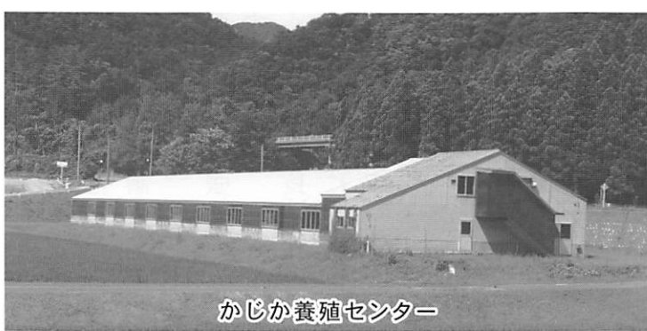
かじか養殖センター

平成23年から25年までの間、ドジョウの養殖場として貸付けていましたが、それ以降有効な活用が図られていないのが現状です。今年5月に入って荒川漁業協同組合から、サクラム等の養殖に使用したいとの要望の提出があり、現在の施設の貸付けに向けて所要の調整を行っています。