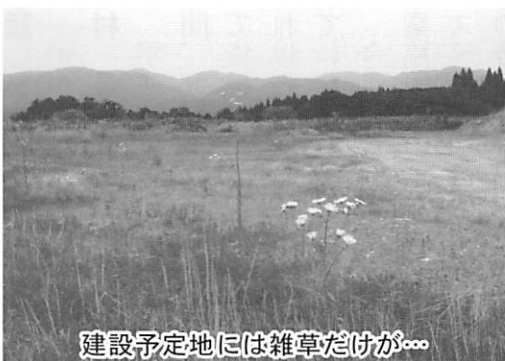
建設予定地には雑草だけが...

なお、前村長は補助参加人として裁判に直接参加することになっていきます。裁判が長引けば村の負担も大きくなる、また裁判のために職員一人が専従しているとの話も聞いている。優秀な人材が裁判だけの仕事ではもつたない。この問題の一日も早い収束を期待する。