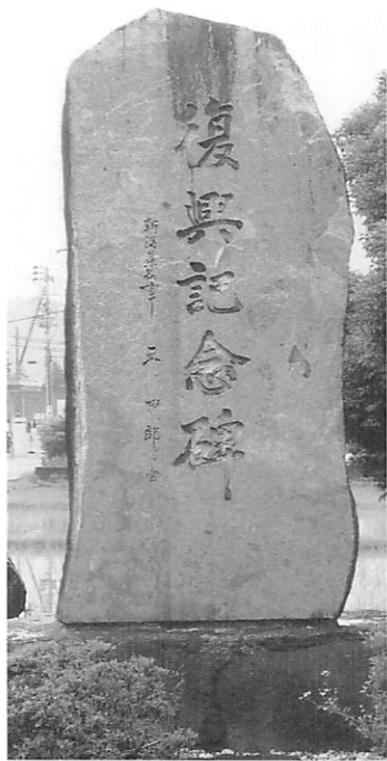
羽越水害 復興記念碑

村民が40%となった今、あの惨状を知る人が少なくなってきた。村当局では、地域防災計画に基づき「洪水ハザードマップ」を配布、「土砂災害ハザードマップ」も近く作成する計画という。又、全村で行う防災訓練や自主防災組織づくりなど、官民連携して行動しているところである。 近年、温暖化の影響か、雨の降り方が局地化、集中化、激甚化の傾向にあり、全国各地で水害が多発している。 自然豊かな「山と川と湯の里」関川村で安全、安心して暮らしていけるよう、一人一人が日頃から防災意識を持ち、地域ぐるみで備えておくことが大切と思っている。