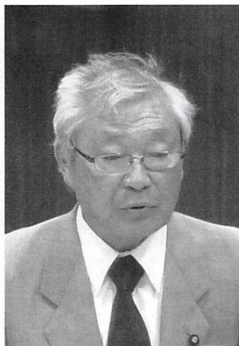
伊藤 範昭 議員

発は高くつくのだ。その上、軟弱地盤についてと佐渡海盆遠縁断層と敷地内の断層の評価は終わっていない。たとえ、新規制基準に適合しても事故が起きない保障はない。柏崎刈羽を再稼働して福島の犠牲になりたくない。 村長 三上さんのコストは計算の根拠がわからないので評価できない。原発コスト10.1円は資源エネルギー庁の資料である。コストに賠償費用は含めるべきでない。原発はリスクとつきあう必要がある。