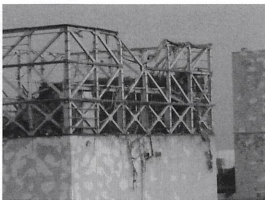
福島第一原子力発電所