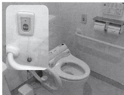
トイレ非常用ボタン

村長 村内の公共施設の「トイレ」5ヶ所に「非常呼び出しボタン」を設置してある。今後、浴室設置は考えていきたい。危機管理として必要の所は設置を増やしていきたい。