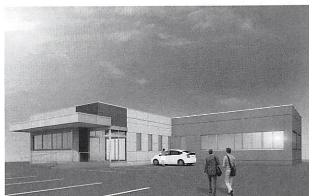
刈羽村新産業会館イメージ