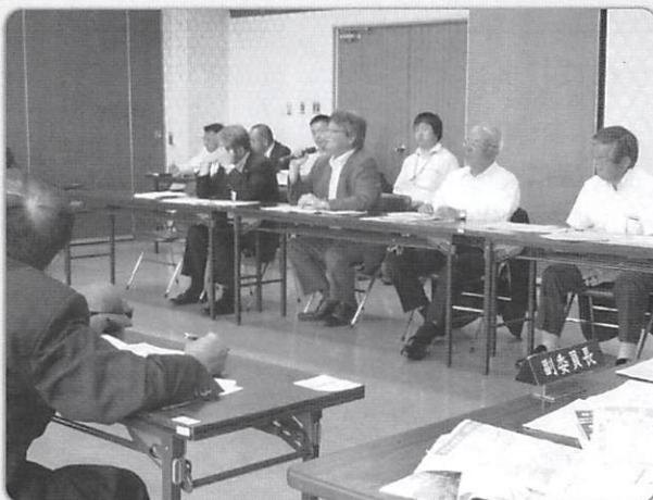
楡葉町視察研修風景