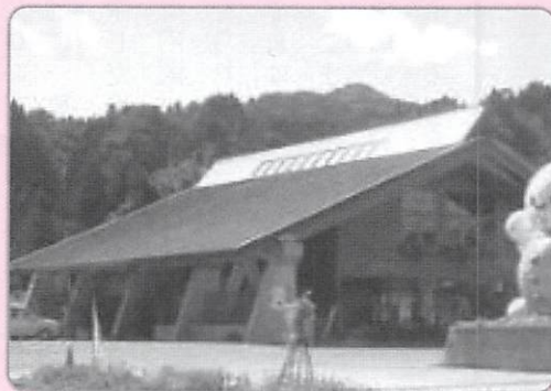
観光施設への再エネ活用イメージ

平成30年度の公募で採択された事業内容はエネルギービジョンの策定とF S調査(可能性の調査)であり、今年度の内示額は2,255万1,900円で、ビジョンの策定費には1,115万7,900円を予定し、F S調査は地中熱調査に約1,139万4,000円を予定している。財源は全て国の補助金で賄われる。