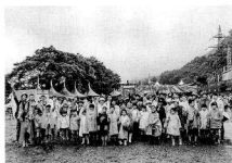
湯沢学園 児童生徒見学会

フジロックで使用されているボスターやパンフレット類を、地元木材を原料に使用した「フジロックペーパー」で作成したり、場内のボードウォークの整備や補修、湯沢産の杉を使用した割り箸の作成・使用などで、この地域の森林保全・地域振興を図っています。湯沢学園の児童生徒の見学会も4年目を迎え、保護者も加えた合計100名以上の方が、フジロックの森の見学を行いました。