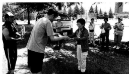
優勝した中山さんへ表彰状とトロフィーが授与されました