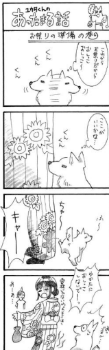
※向やにちがひしきユウキんごしよ