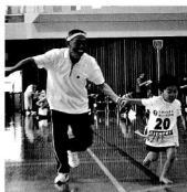
じいちゃん、ばあちゃんつれてって