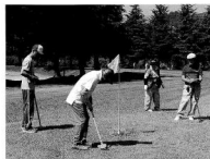
絶好の大会日和でした